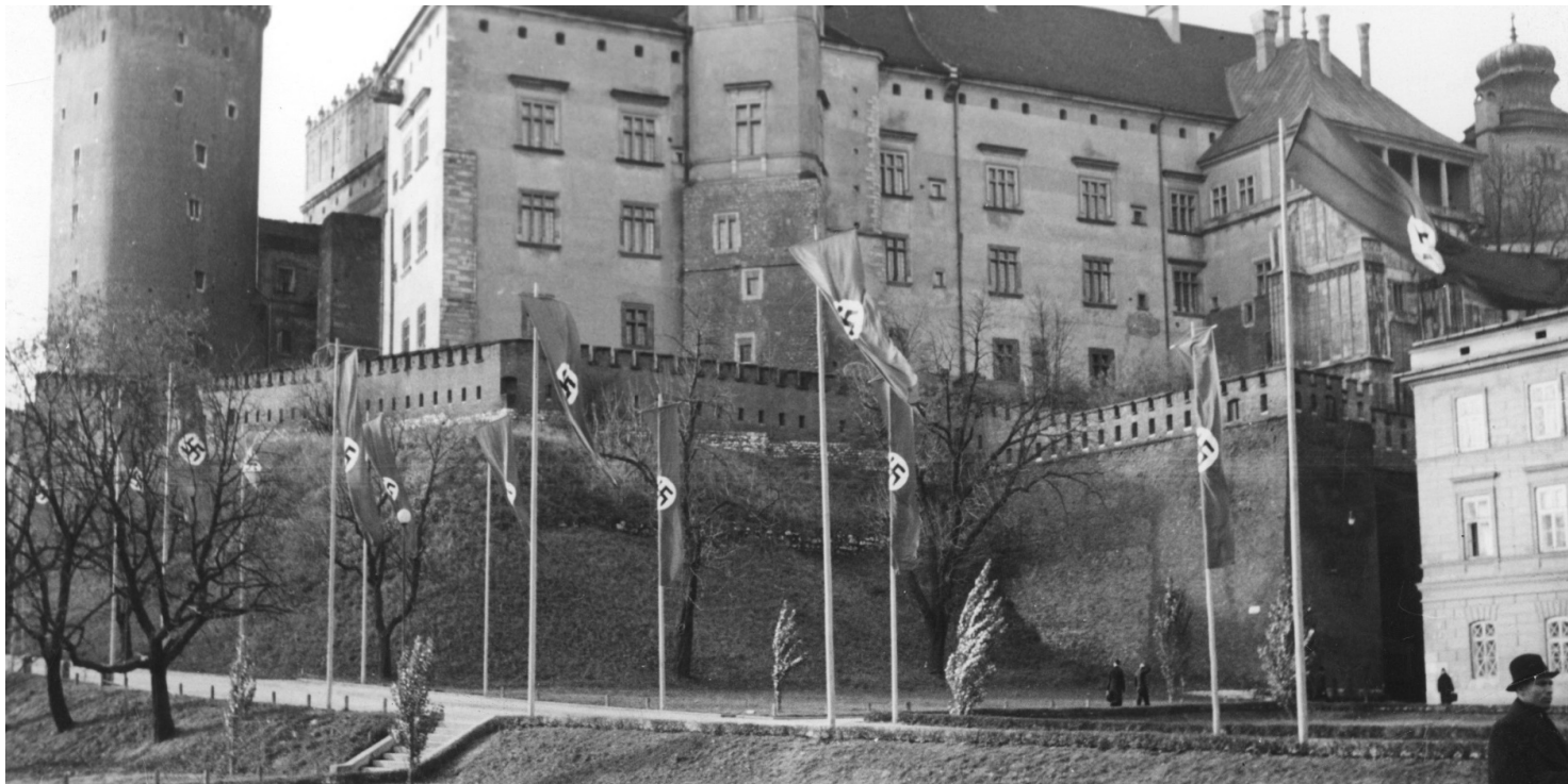
Zamek Królewski na Wawelu zamieniony w siedzibę władz Generalnego Gubernatorstwa

https://przystanekhistoria.pl/pa2/teksty/126029,Czy-Generalne-Gubernatorstwo-bylo-terytorium-okupowanym.html