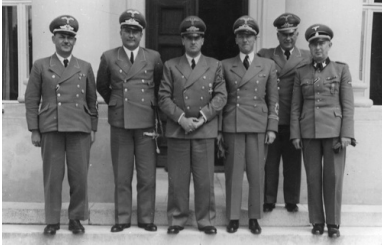
Generalny Gubernator Hans Frank w towarzystwie gubernatorów dystryktów - fotografia grupowa. Od lewej widoczni Ernst Kundt, Ludwig Fischer, Hans Frank, Otto Wachter, Ernst Zorner i Richard Wendler., październik 1942 r.

Zgodnie z przepisami na władzy okupacyjnej spoczywa obowiązek podjęcia wszelkich dostępnych środków w celu przywrócenia i zapewnienia porządku życia społecznego. Władza okupacyjna przejmuje nie tylko uprawnienia, ale i zobowiązania państwa okupowanego, działając w charakterze powiernika. Jest ona zobowiązana do poszanowania praw obowiązujących w danym kraju, a nawet przejęcia funkcji opiekuńczych (wypłacanie emerytur i świadczeń społecznych, utrzymanie i świadczenie opieki zdrowotnej).