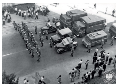
Protest robotników tłumili oddziały MO i ZOMO, ul. 1 Maja w Radomiu, czerwiec 1976 r.

Dobrowolska Chojeckiego do sądu nie pozwała i na jego słowa nie zareagowała. Dwa lata później zmarła. Nie objęło jej żadne postępowanie dyscyplinarne – już wówczas możliwe w oparciu o uchwaloną w 1998 r. ustawę o odpowiedzialności dyscyplinarnej sędziów, którzy w latach 1944–1989 sprzeniewierzyli się niezawisłości sędziowskiej. Dziennikarce „Gazety Wyborczej”, która pytała ją o procesy czerwcowe, odparła, że nie zamierza wracać do tamtej przeszłości, bo „ten temat jest już dla niej ostatecznie zamknięty”.