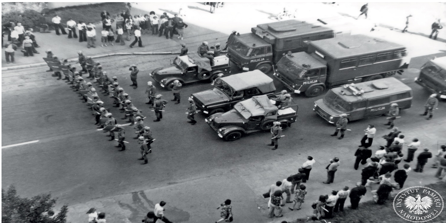
Protest robotników tłumili oddziały MO i ZOMO, ul. 1 Maja w Radomiu, czerwiec 1976 r.

https://przystanekhistoria.pl/pa2/teksty/125753,Radom-76-Sedziowie-czerwcowi-dwa-szkice-do-portretow.html