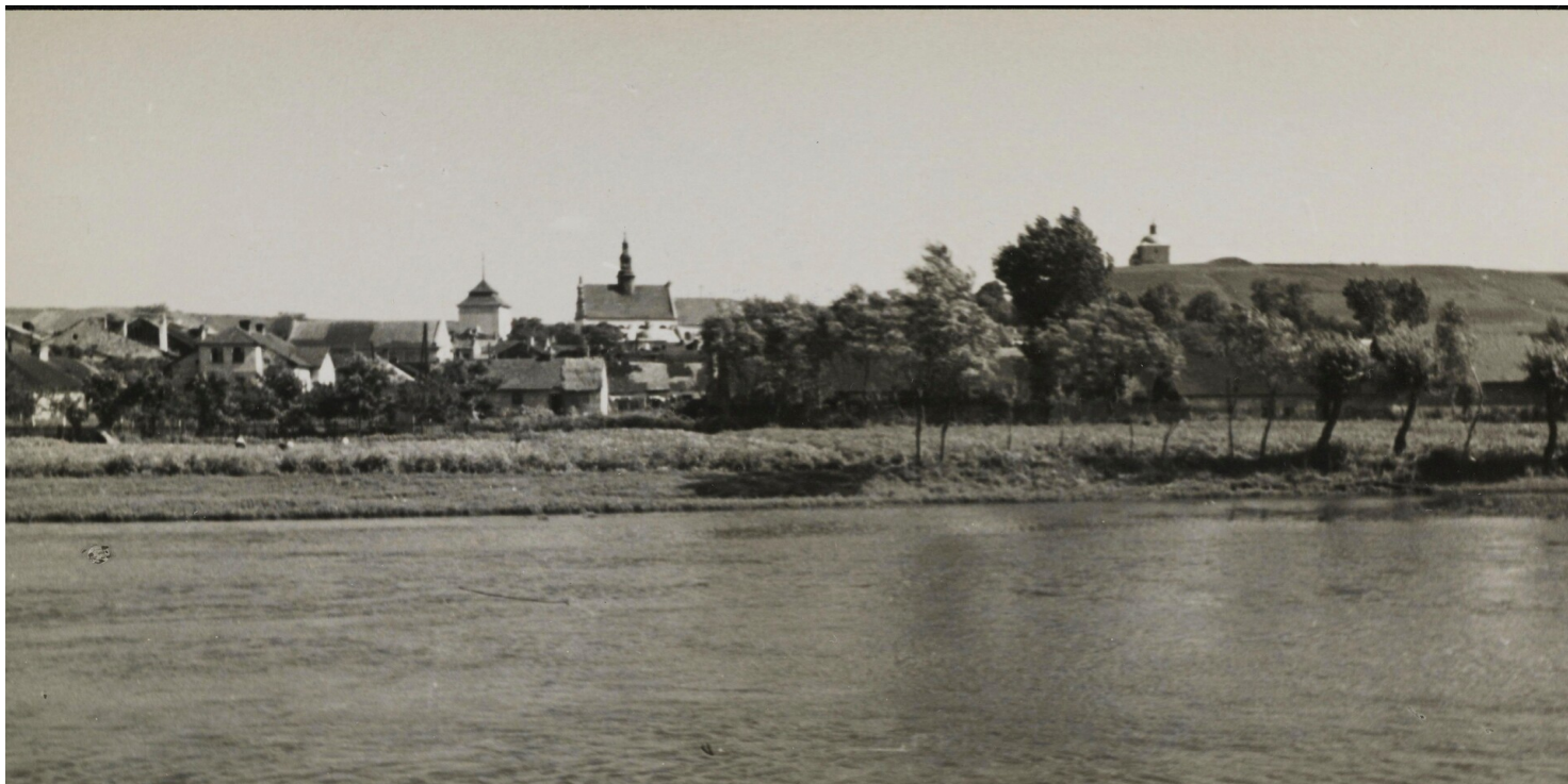
Pińczów od strony Nidy

https://przystanekhistoria.pl/pa2/teksty/125633,Wierni-Przyrzeczeniu-Konspiracja-harcerska-w-Pinczowie-1945-1950.html