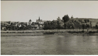
Pińczów od strony Nidy (fot. polona.pl)