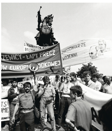
Demonstracja Solidarności Walczącej w czasie wizyty prezydenta USA George'a Busha