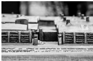
Świętochłowice-Zgoda. Fragment makiety przedstawiającej teren obozu, ustawionej przez wejściem na jego dawny teren.

Faktem jest, że wielu osadzonych padło ofiarami nadużyć funkcjonariuszy UB, a ich jedyną „winą” było dobrze urządzone mieszkanie czy brak dokumentów, ale najczęściej powodem umieszczenia w obozie pozostawał jednak wpis na folkslistę czy niemieckie obywatelstwo. Za drutami obozu znaleźli się także podejrzani o popełnienie różnych przestępstw w okresie wojny.