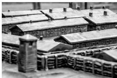
Świętochłowice-Zgoda. Fragment makiety przedstawiającej teren obozu, ustawionej przez wejściem na jego dawny teren.

Jako „zbrodniarzy faszystowsko-hitlerowskich” zamykano przede wszystkim członków SA i NSDAP. Sprawy co najmniej 18 takich osób rozpatrywał później Specjalny Sąd Karny w Katowicach (dwunastu z nich zostało skazanych, w tym jeden na dożywotnie więzienie). Część osób z poważnymi zarzutami zmarła przed rozprawą