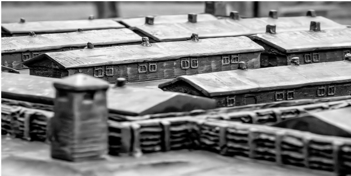
Świętochłowice-Zgoda. Fragment makiety przedstawiającej teren obozu, ustawionej przez wejściem na jego dawny teren.

https://przystanekhistoria.pl/pa2/teksty/125549,Nie-powiedziano-nam-dlaczego-nas-zabrano-Osadzeni-w-obozi-e-w-Swietochlowicach-Zg.html