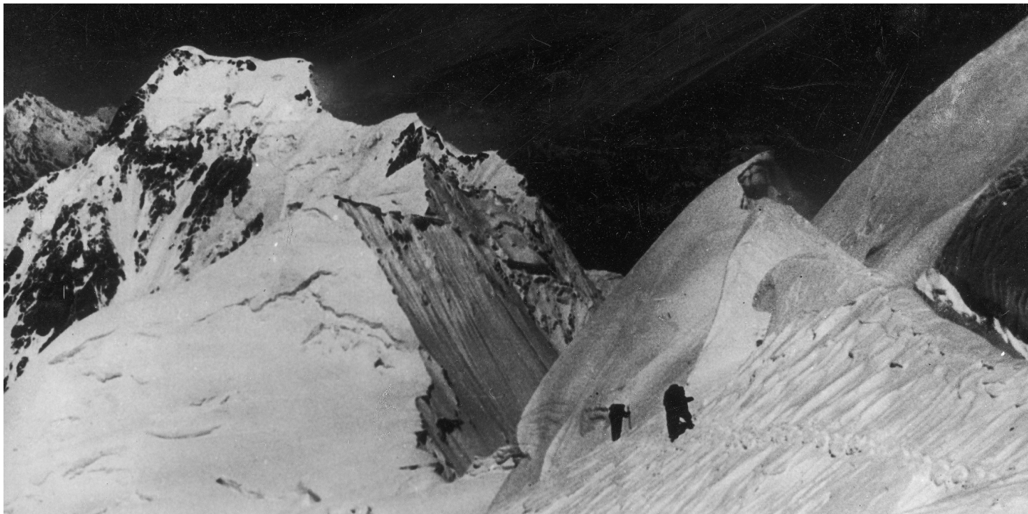
Wspinaczka na Nanga Prabat, wyprawa Willyego Merkla, 1934 r.

https://przystanekhistoria.pl/pa2/teksty/125518,Najwazniejsze-bylo-po-prostu-byc-w-gorach-Halina-Krger-Syrokomka.html