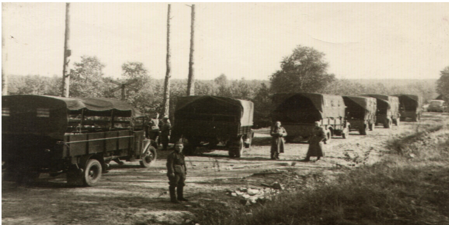
Kolumna ciężarówek z transportem więźniów Pawiaka na miejsce straceń w Palmirach, obok samochodów widoczni niemieccy żandarmi, 1939-1941

https://przystanekhistoria.pl/pa2/teksty/125479,Egzekucje-wiezniow-Pawiaka-w-ruinach-getta.html