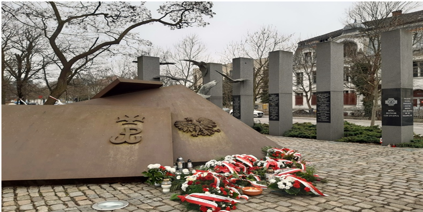
Pomnikiem Polskiego Państwa Podziemnego w Poznaniu, 2021 r.

https://przystanekhistoria.pl/pa2/teksty/125356,Wyklęty-w-Wielkopolsce-Szkie-biograficzny-podpułkownika-Andrzeja-Rzewuskiego-189.html