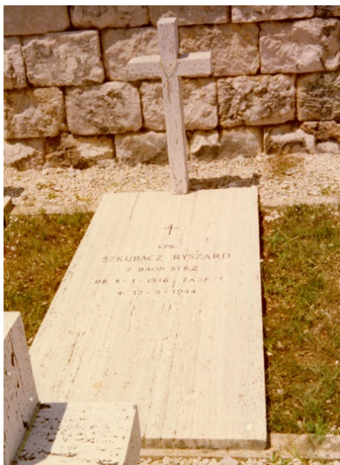
Nagrobek Ryszarda Szkubacza na cmentarzu polskim pod Monte Cassino