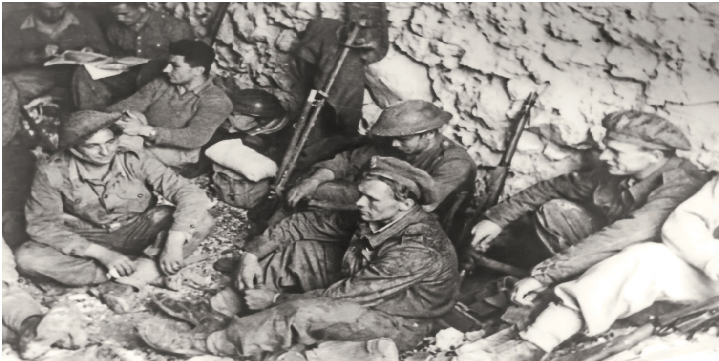
Żołnierze 5 Kresowej Dywizji Piechoty pod Monte Cassino, maj 1944 r.

https://przystanekhistoria.pl/pa2/teksty/125206,Wszystkim-prowincjom-Polski-zejsc-przyszlo-na-krwawe-rzemioslo-Sluzacy-pod-Monte.html