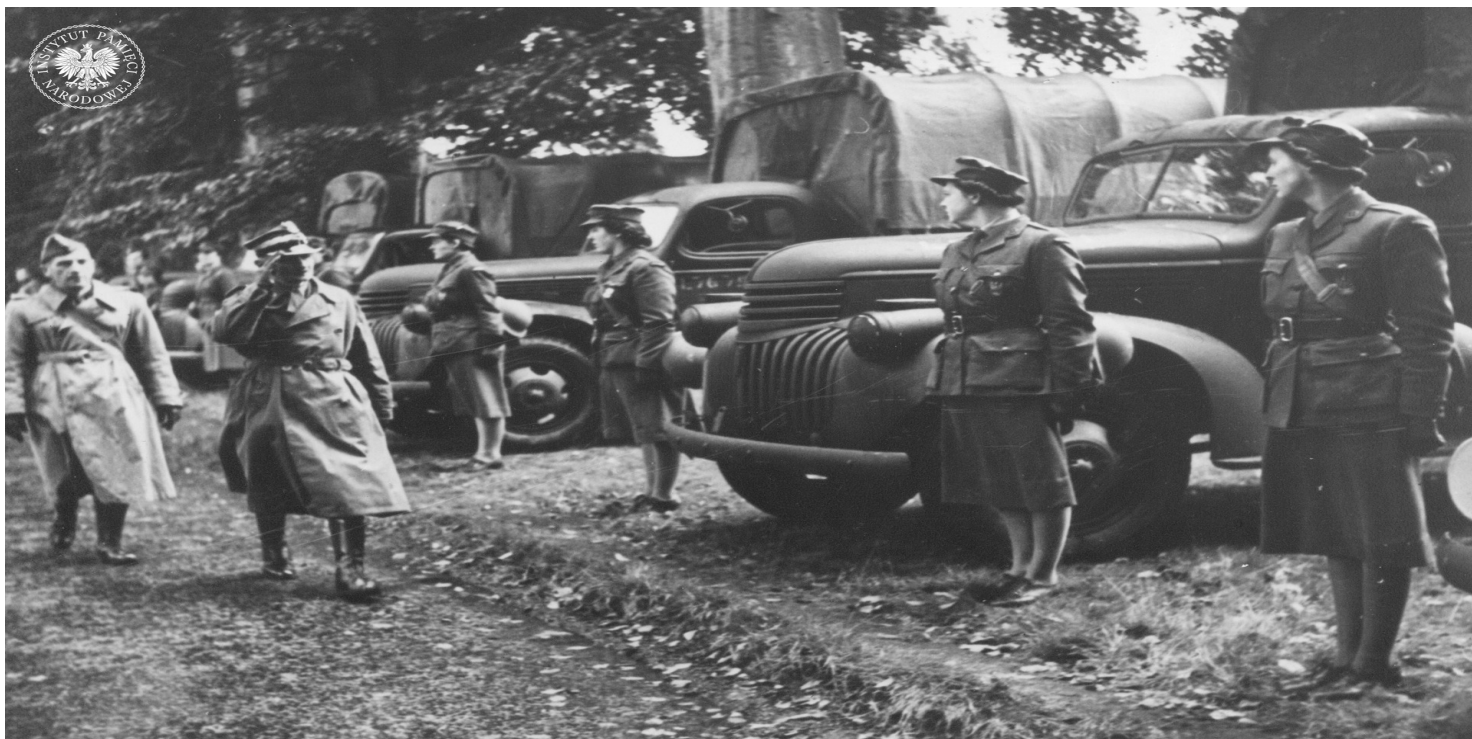
Generał dywizji Marian Kukiel przechodzi salutując podczas inspekcji oddziału samochodowego Pomocniczej Służby Kobiet, stacjonującego w Wielkiej Brytanii

https://przystanekhistoria.pl/pa2/teksty/125125,General-Marian-Kukiel-Historyk-w-mundurze.html