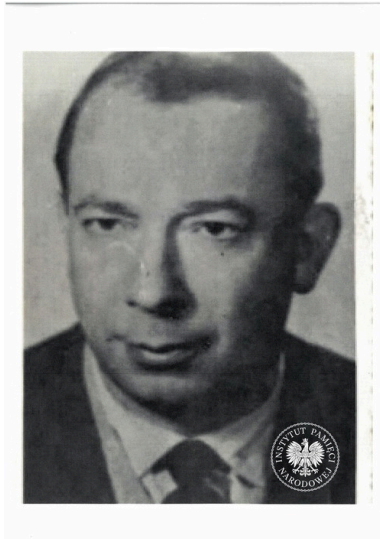
Stanisław Grzesiuk