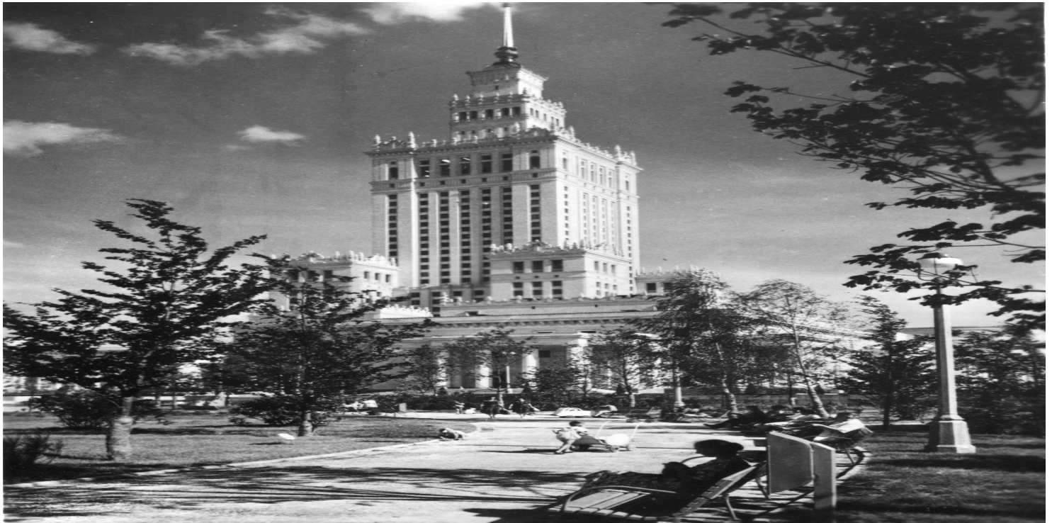
Pałac Kultury i Nauki, domena publiczna

https://przystanekhistoria.pl/pa2/teksty/106692,Socrealizm-w-Polsce.html