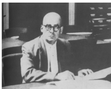
Mieczysław Grydzewski (fot. domena publiczna)

Z urodzenia Mieczysław Gryczendler. Atrybut wizerunku: czworonóg (Grydzewski redagował przed wojną także prekursorskie czasopismo „Przyjaciel Psa”). Miasto wyjścia z ojczyzny: Warszawa. Miejsce wygnania: Londyn.