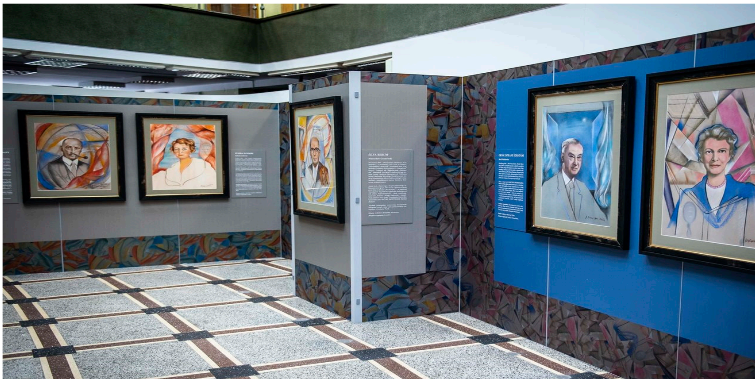
Wystawa IPN „Londyn żywy” w Centrum Edukacyjnym „Przystanek Historia” IPN w Krakowie, 2022 r.

https://przystanekhistoria.pl/pa2/teksty/106675,Silva-rerum-czyli-Mieczyslaw-Grydzewski.html