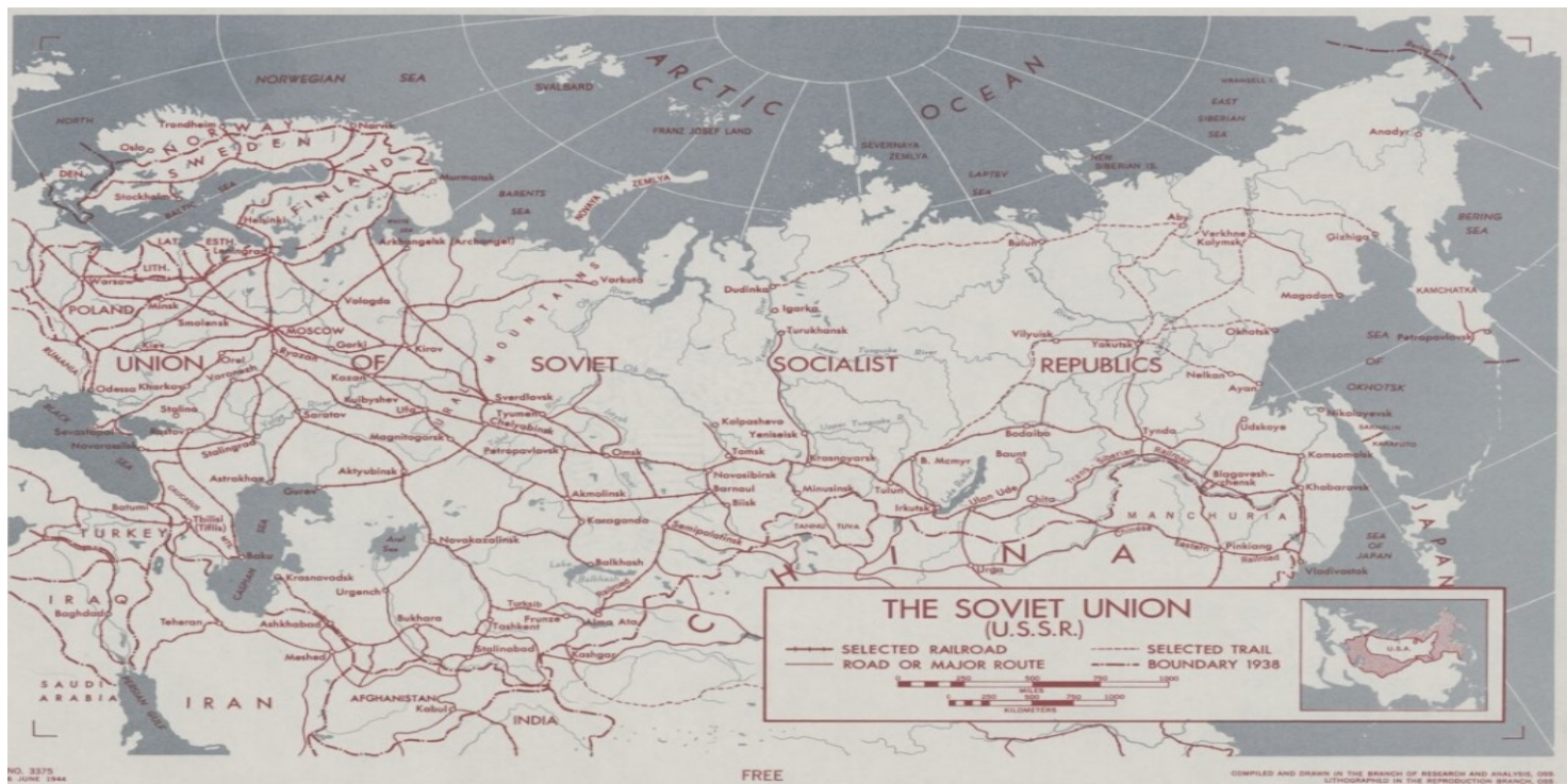
The Soviet Union (U.S.S.R.), Waszyngton 1944

https://przystanekhistoria.pl/pa2/teksty/106387,Polscy-biolodzy-w-czasach-lysenkizmu.html