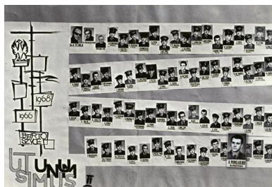
Pamiętkowe tableau alumnów-żołnierzy 54. SBRT w Bartoszycach służących w latach