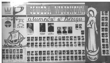
Tableau służby wojskowej alumnów w jednostce wojskowej w Brzegu w latach 1967-1969

Szacuje się, że do wojska powołano blisko 3000 alumnów, choć jest to liczba niepewna. Najwięcej wcielono ich w drugiej połowie lat sześćdziesiątych, co było spowodowane silnym napięciem stosunków państwa i Kościoła w związku z konfrontacją milenijną, czyli kościelnymi obchodami Milenium Chrztu Polski i państwowymi Tysiąclecia Państwa Polskiego. Rekordowy był rok 1968, gdy do wojska powołano prawie 300 kleryków z całego kraju. Wyraźny spadek liczby wcielanych, a także powolne osłabianie tej antykościelnej represji, następowały od połowy lat siedemdziesiątych. W 1973 roku zlikwidowano jednostkę w Szczecinie, w 1979 w Brzegu. W 1979 wcielono też ostatnich kleryków, by w kwietniu 1980 roku zwolnić ich wszystkich. Było to skutkiem wieloletnich zabiegów Episkopatu Polski i samego prymasa Wyszyńskiego.