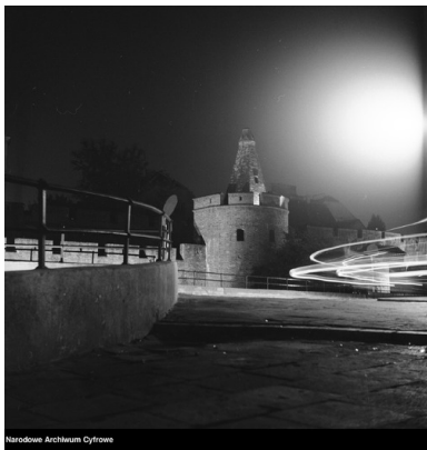
Stare Miasto nocą - 1975 r.

Marzeniem prof. Zachwatowicza była odbudowa dawnej Warszawy, co było możliwe dzięki zachowaniu dokumentacji. Mimo znacznego zmniejszenia proponowanego przez Zachwatowicza obszaru odbudowy, to dzięki jego determinacji udało się odtworzyć znaczną część Starego Miasta i Traktu Królewskiego.