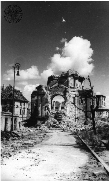
Ruiny kościoła Sakramentek pw. św. Kazimierza na Nowym Mieście