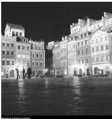
Stare Miasto nocą - 1975 r.