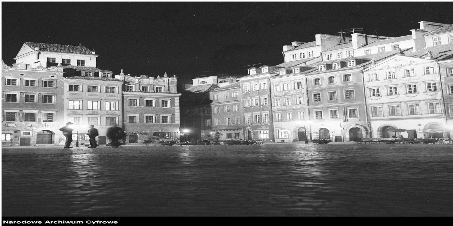
Stare Miasto nocą - 1975 r.

https://przystanekhistoria.pl/pa2/teksty/106260,Biuro-Odbudowy-Stolicy.html