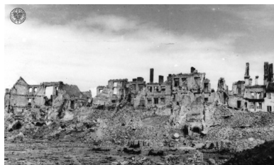
Ruiny Starego Miasta - panorama - 1945 r. (fot. z zasobu AIPN)