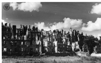
Ruiny Starego Miasta - panorama od strony Wisły - 1945 r.

Niemcy celowo dewastowali obiekty dziedzictwa polskiej kultury i historii, mające dla Polaków szczególną wartość: obalili kolumnę Zygmunta, rozjechali czołgiem płytę Grobu Nieznanego Żołnierza, wysadzili w powietrze Zamek Królewski i Pałac Saski. Wkrótce po upadku walk powstańczych na Starym Mieście spalili mieszczące się tam instytucje, m.in. Bibliotekę Ordynacji Zamojskiej, Archiwum Akt Dawnych oraz Archiwum Skarbowe.