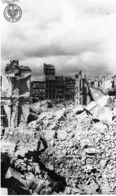
Ruiny Starego Miasta - fragment ryнку, na pierwszym planie ruiny katedry św. Jana - 1945 r.