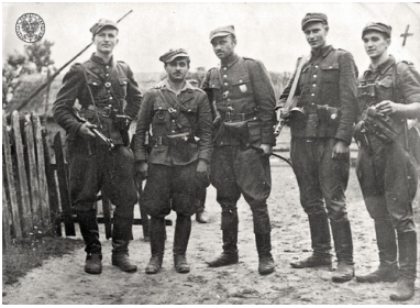
Żołnierze 5. Brygady Wileńskiej AK. Białostoczczyzna, 1945 r.