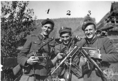
Członkowie 5. Brygady Wileńskiej