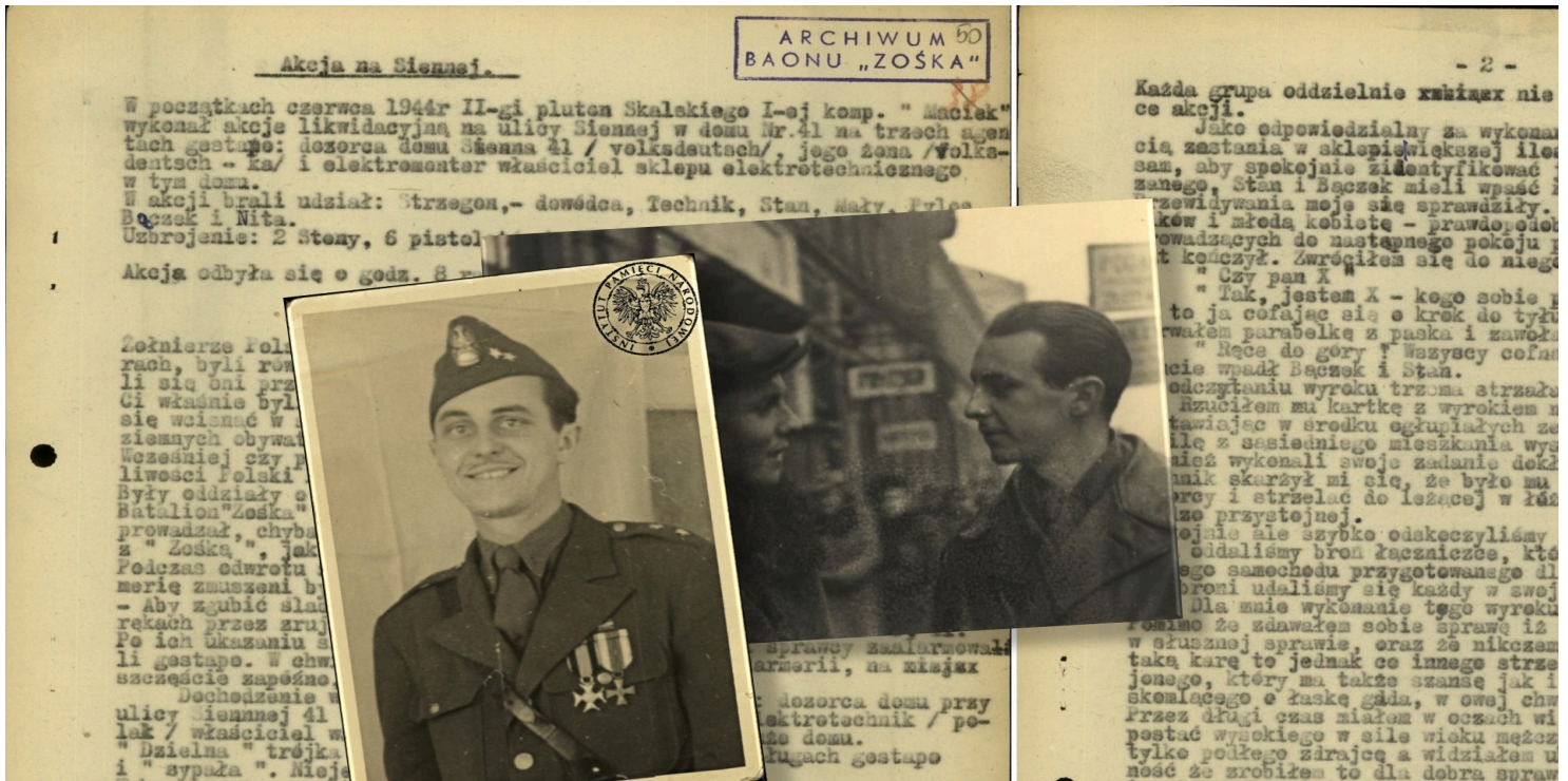
Materiały z zasobu AIPN)

https://przystanekhistoria.pl/pa2/teksty/106006,Jan-Rodowicz-Anoda.html