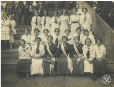
Członkinie Związku Sokołów Polskich w Ameryce z gniazda nr 17 w Newark w stanie New Jersey podczas XIII Zlotu I Okręgu. Brooklyn w stanie Nowy Jork, 4-6 lipca 1913 r.

Z biegiem czasu używano ich coraz częściej przy okazji różnych wydarzeń politycznych, jako symboli ruchów społecznych czy kampanii reklamowych. W erze XX-wiecznej kultury masowej technologia wytwarzania przypinek uległa niesłychanemu rozwojowi, a zasięg ich oddziaływania stał się wręcz powszechny. Powstawały coraz to doskonalsze wersje i typy wpinek, odznak oraz gadżetów, mających świadczyć o przynależności lub popieraniu kogoś bądź czegoś przez noszącą je osobę.