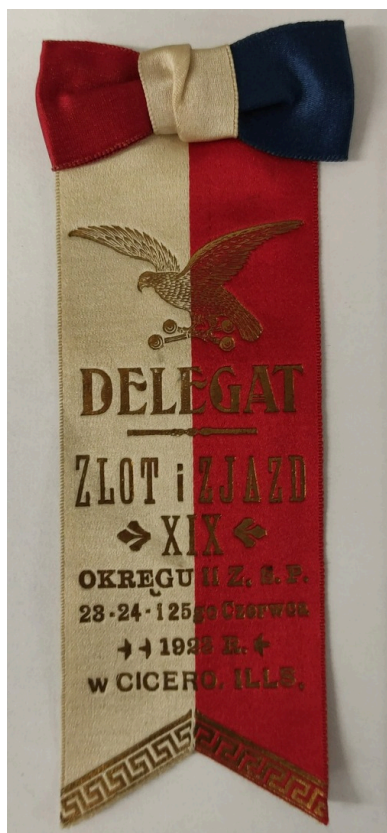
Przypinka delegata na XIX Zlot i Zjazd II Okręgu Związku Sokołów