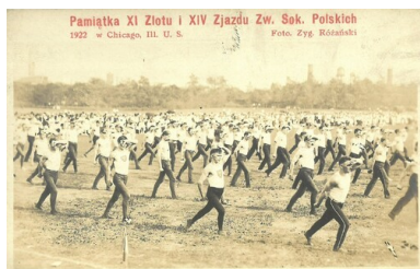
Pamiętka z XI Zlotu i XIV Zjazdu Związku Sokołów Polskich w Ameryce w Chicago w stanie Illinois, 1922 r.