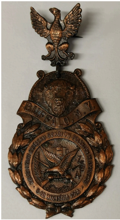
Przypinka z XI Walnego Zjazdu i IX Złotu Związku Sokołów Polskich w Ameryce w Buffalo w stanie Nowy Jork, 6-10 września 1914 r.