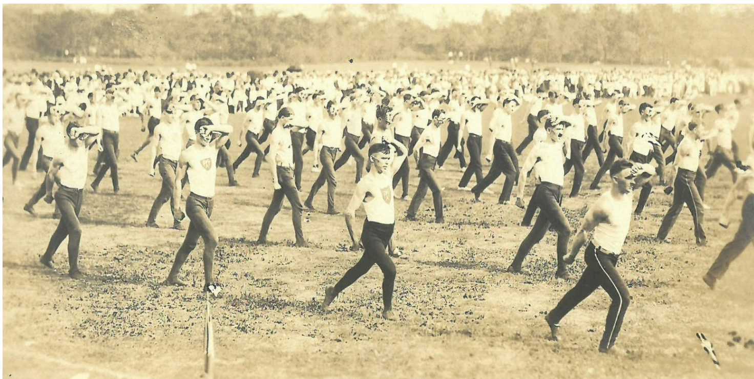
Sokolstwo Polskie w Ameryce w Chicago w stanie Illinois, 1922 r.

https://przystanekhistoria.pl/pa2/teksty/105984,Odznaki-Sokolstwa-Polskiego-w-Ameryce.html