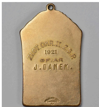
Medal ze Złotu II Okręgu Związku Sokołów Polskich w Ameryce (rewers), 1921 r.