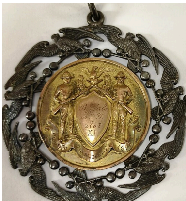
Medal okolicznościowy za najliczniejszy udział w ćwiczeniach podczas XI Walnego Zjazdu i IX Złotu Związku Sokołów Polskich w Ameryce w