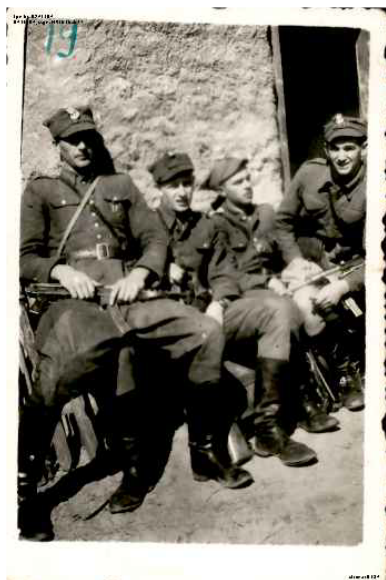
Pierwszy od lewej por. „Stefan”, Podlasie 1945 r.

znana z wcześniejszych przywołań. Nowością jest informacja o okolicach Ełku jako miejscu, gdzie na przełomie 1945 i 1946 r. miał „zamelinować” się por. „Stefan”. Jest to szczegół, który uważam za niezwykle ważny przy próbie identyfikacji tego oficera. Natomiast „Regina” błędnie określiła wiek „Stefana”, czyniąc go rówieśnikiem „Łupaszki” (ur. 1910 r.), czemu przeczy zdecydowana większość zachowanych źródeł, w tym zachowanych zdjęć, na których widoczny jest adiutant mjr. Szendzielarza.