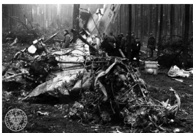
Szczątki samolotu rządowego Antonow AN-24W, który rozbił się w pobliżu lotniska Szczecin-Goleniów nocą, 28 II 1973 r.