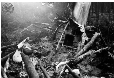
Szczątki samolotu rządowego Antonow AN-24W, który rozbił się

Więcej interesujących materiałów na profilu Archiwum IPN