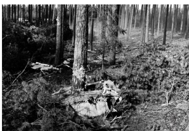
Szczątki samolotu rządowego Antonow AN-24W, który rozbił się