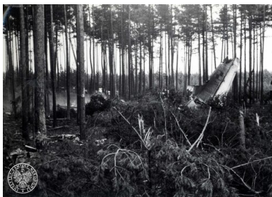
Szczątki samolotu rządowego Antonow AN-24W, który rozbił się w pobliżu lotniska Szczecin-Goleniów nocą, 28 II 1973 r.