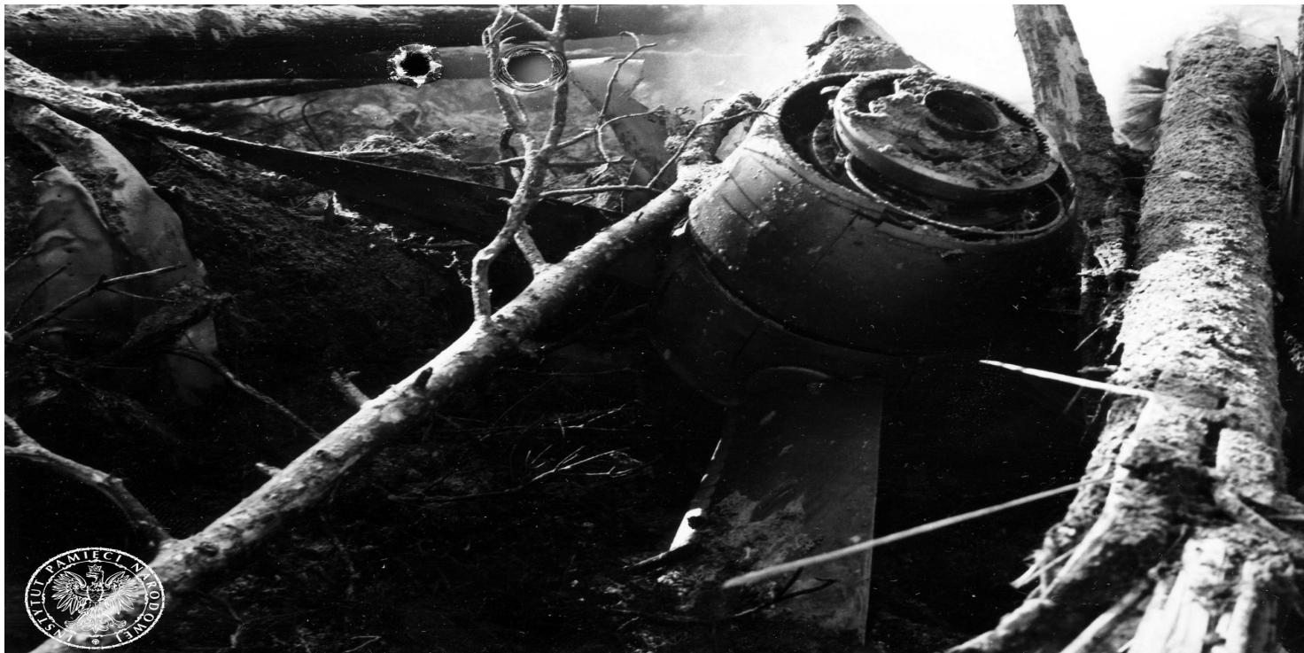
Szczątki samolotu rządowego Antonow AN-24W, który rozbił się w pobliżu lotniska Szczecin-Goleniów nocą, 28 II 1973 r.

https://przystanekhistoria.pl/pa2/teksty/105885,Katastrofa-rzadowego-samolotu-AN-24W-pod-Goleniowem.html