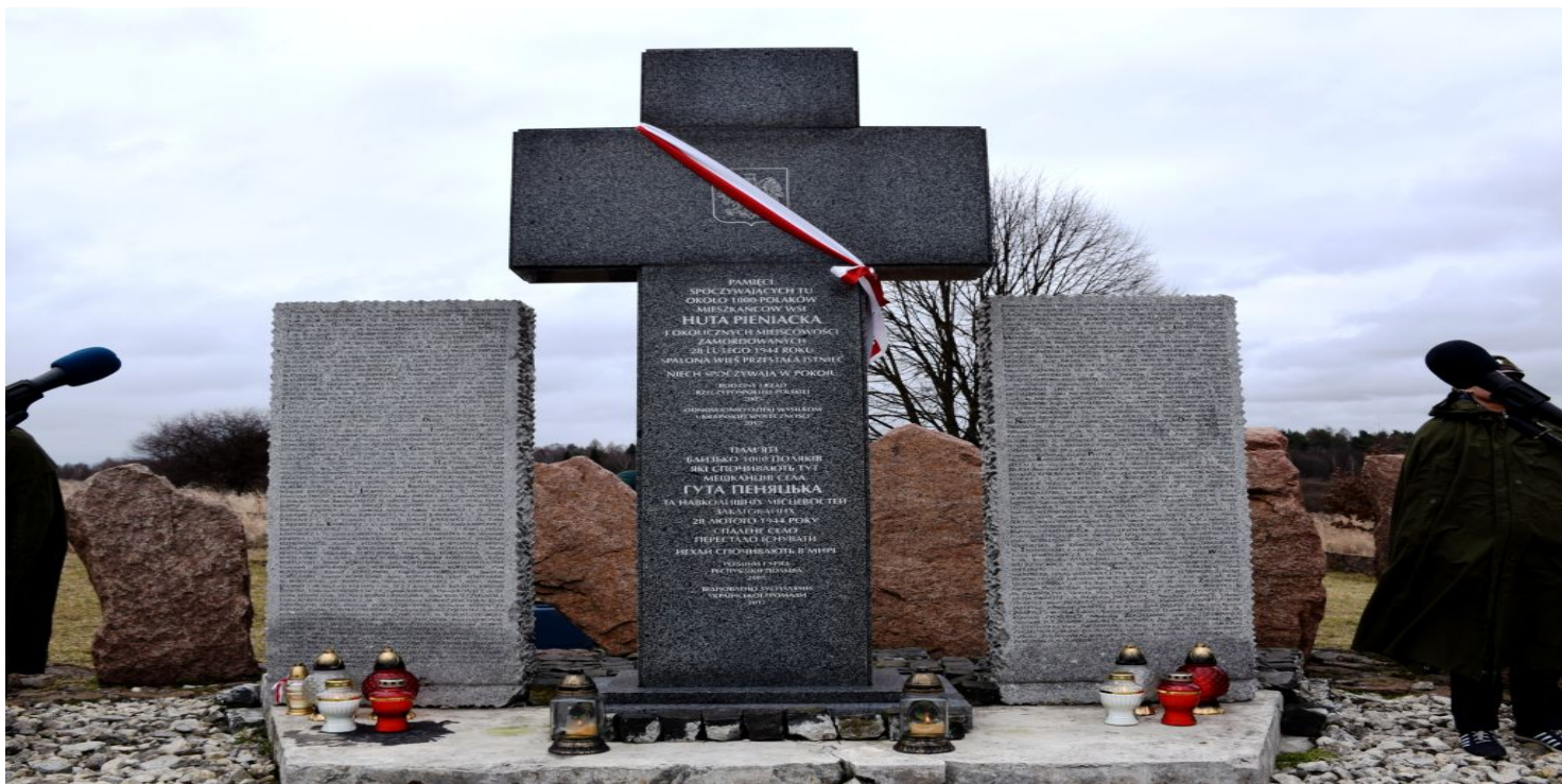
Pomnik poświęcony ofiarom w Hucie Pieniackiej, 2020 r.

https://przystanekhistoria.pl/pa2/teksty/105880,Zbrodnia-w-Hucie-Pieniackiej.html