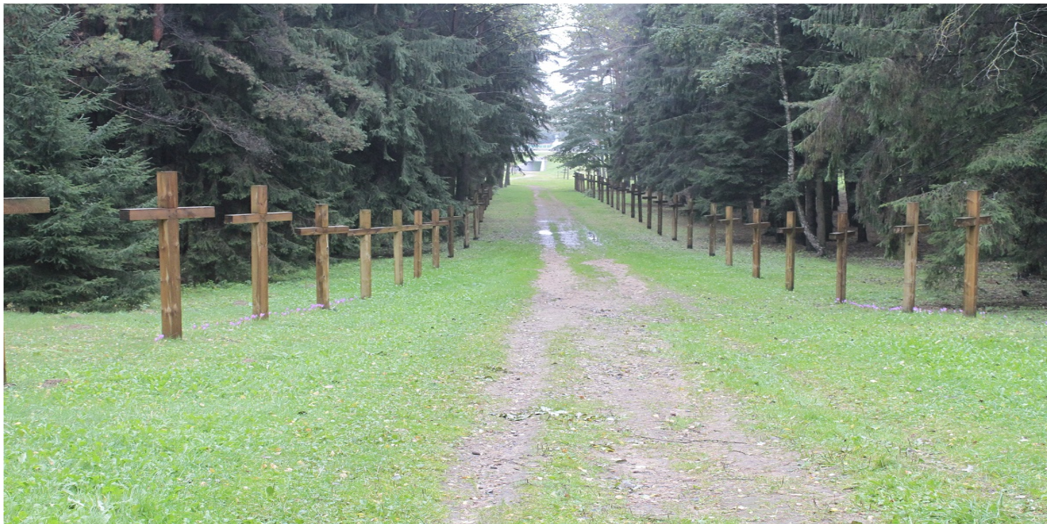
Uroczysko Kuropaty

https://przystanekhistoria.pl/pa2/teksty/105861,Kuropaty-miejsce-masowych-egzekucji-sowieckich.html