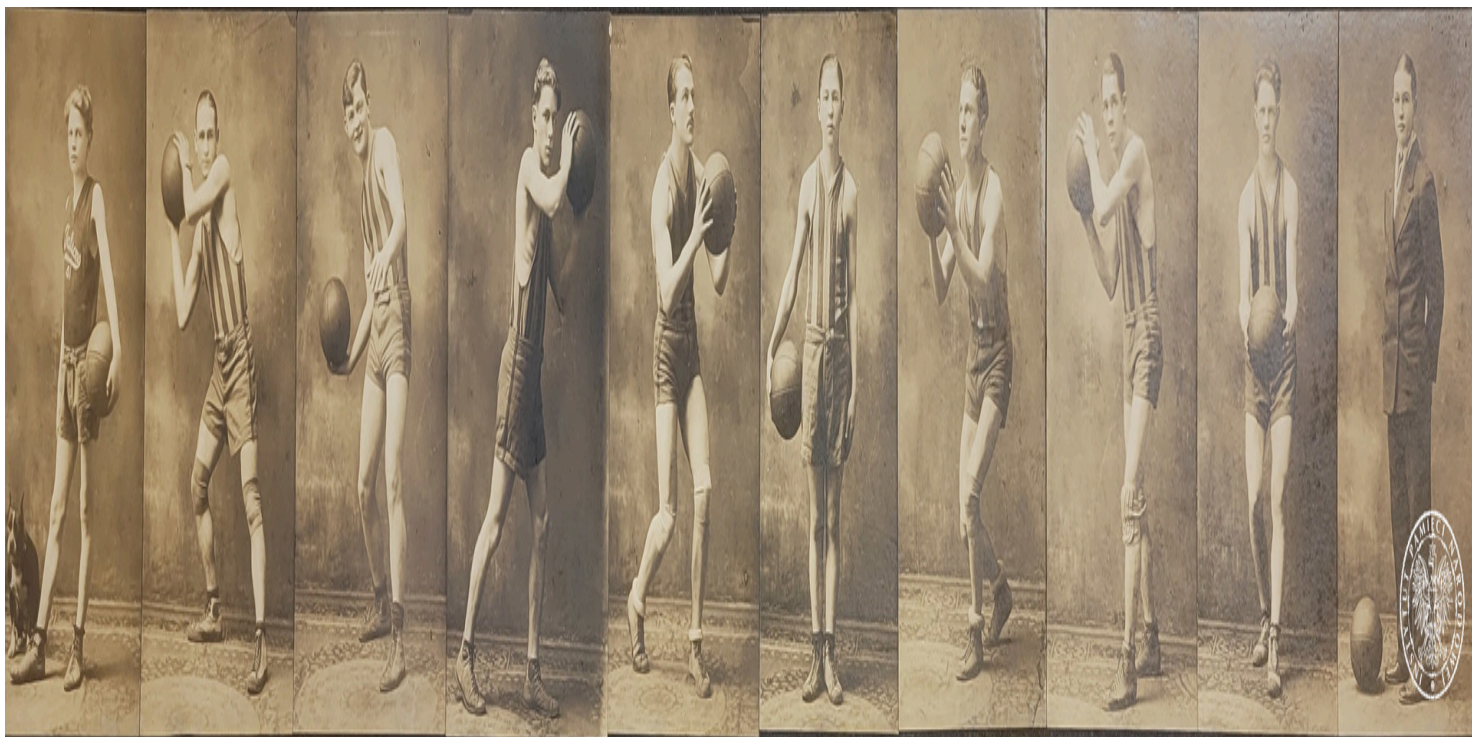
Koszykarze Sokolstwa Polskiego w Ameryce z gniazda nr 41 w New Kensington – panorama

https://przystanekhistoria.pl/pa2/teksty/105624,Tata-wariata-czyli-koszykowka-w-Archiwum-IPN.html