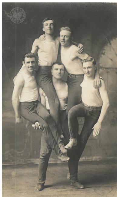
Członkowie Sokolstwa Polskiego w Ameryce podczas akrobacji gimnastycznych, 1915 r.

„Ramię krzep – Ojczyźnie służ”, „W imię przyszłości prostować kości” „Wspieraj ojczyznę, wzmacniając tężyznę”.