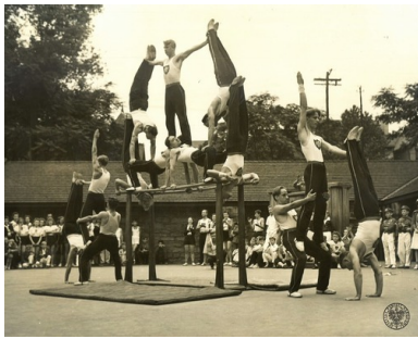
Ćwiczenia fizyczne członków Sokolstwa Polskiego w Ameryce, lata 60 XX w.