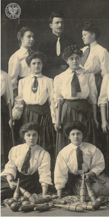
Sokolice ze sprzętem sportowym, ok. 1905-1909 r.