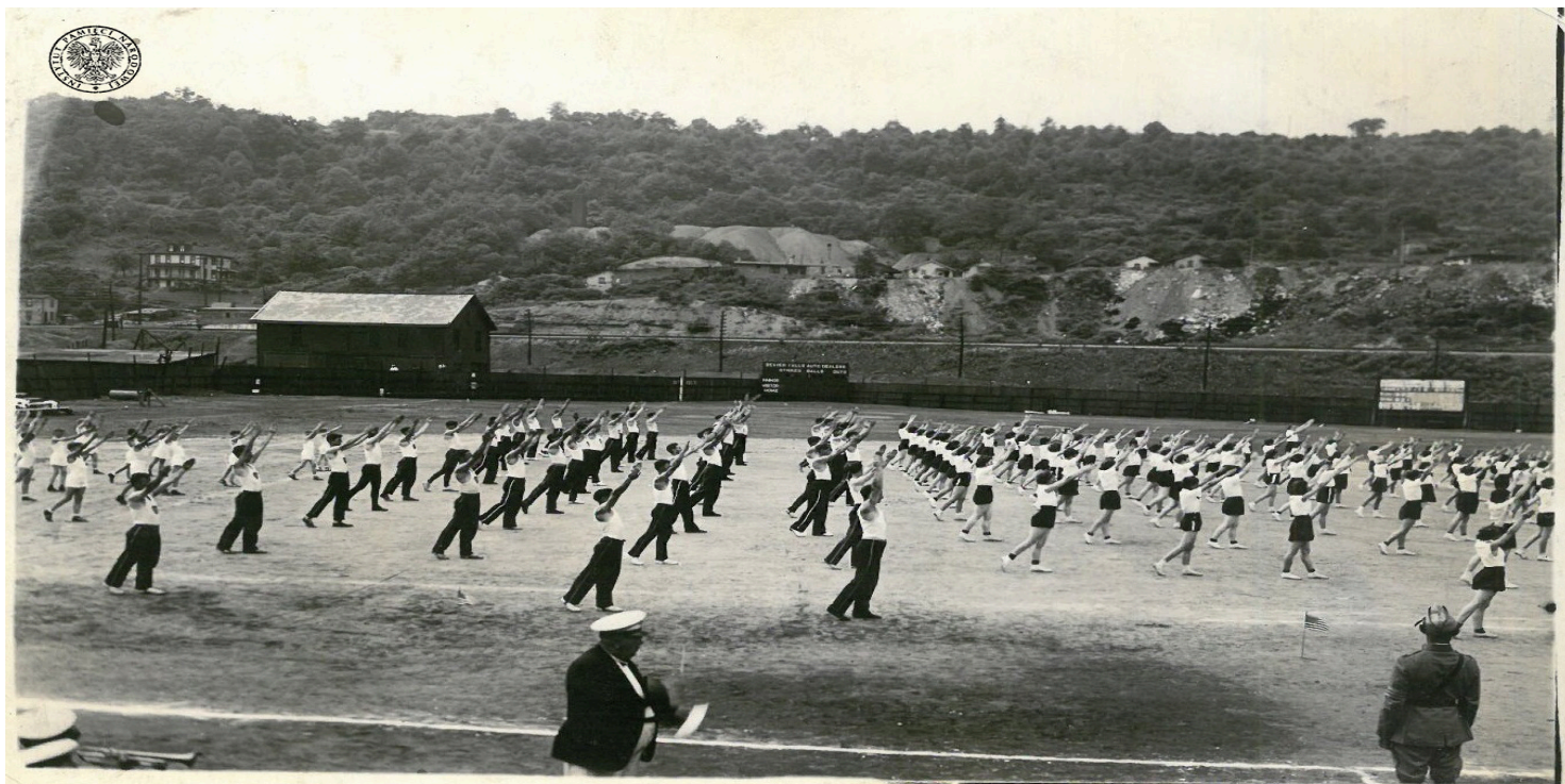
Sokolstwo w strojach sportowych podczas ćwiczeń plenerowych, 1937 r.

https://przystanekhistoria.pl/pa2/teksty/105570,Narodziny-polskiego-Sokolstwa.html