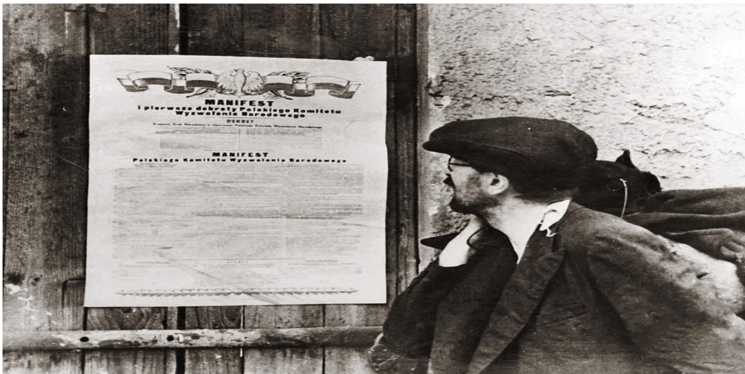
Zdjęcie czytającego plakat manifestu PKWN (domena publiczna)

https://przystanekhistoria.pl/pa2/teksty/105261,Czas-stalinowskiej-nocy-Zniewalanie.html