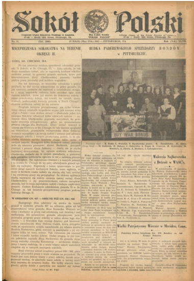
Artykuł z czasopisma „Sokół Polski” dotyczący akcji sprzedaży obligacji wojennych w Pittsburghu, 27 maja 1943 r.

Więcej interesujących materiałów na profilu Archiwum IPN