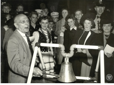
Prezes Sokolstwa Polskiego w Ameryce Teofil Starzyński podczas akcji sprzedaży obligacji wojennych, lata II wojny światowej.

Były one emitowane w nominałach od 25 do nawet 10 tys. dolarów. W zależności od kolejnych edycji pożyczek wojennych, zakup obligacji gwarantował ich nabywcom, po upływie dziesięciu lat, zwrot na poziomie około 2,9% w ujęciu rocznym.