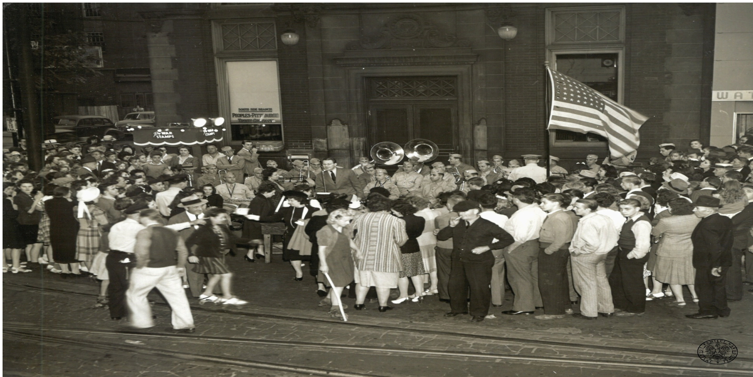
Sprzedaż obligacji wojennych Stanów Zjednoczonych prowadzona przez jeden z kiosków w Pittsburghu, lata II wojny światowej.

https://przystanekhistoria.pl/pa2/teksty/105190,Walka-portfelem-Sokolstwo-Polskie-i-obligacje-wojenne-USA.html