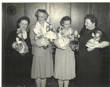
Członkinie Sokoła prezentujące na Targach Polskich w Pittsburghu lalki w polskich strojach ludowych, wykonane przez dzieci z gniazda nr 118 Sokolstwa Polskiego w Ameryce, 1943 r.

Prowadzenie globalnego konfliktu zbrojnego wymagało posiadania ogromnej i doskonale wyposażonej armii. Jej wyekwipowanie w broń, pojazdy i zaopatrzenie oraz kilkuletnie utrzymywanie było gigantycznym wydatkiem dla skarbu każdego państwa. Dla uniknięcia drastycznej podwyżki podatków sekretarz skarbu USA Henry Morgenthau zaproponował zwrócenie się o pożyczki do firm i osób fizycznych poprzez emisję przez rząd publicznych papierów dłużnych nazywanych obligacjami wojennymi.