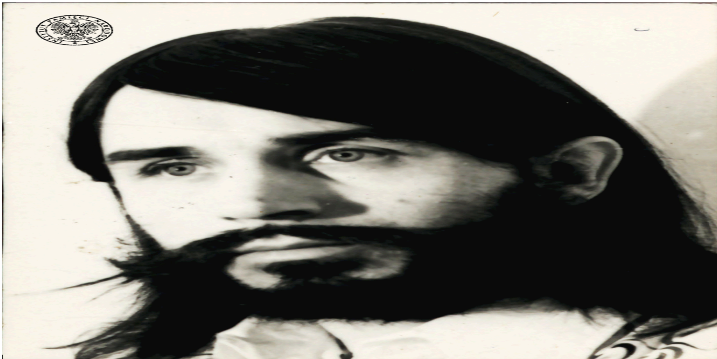
Czesław Niemen (fot. z zasobu IPN)

https://przystanekhistoria.pl/pa2/teksty/105148,Czeslaw-Niemen.html