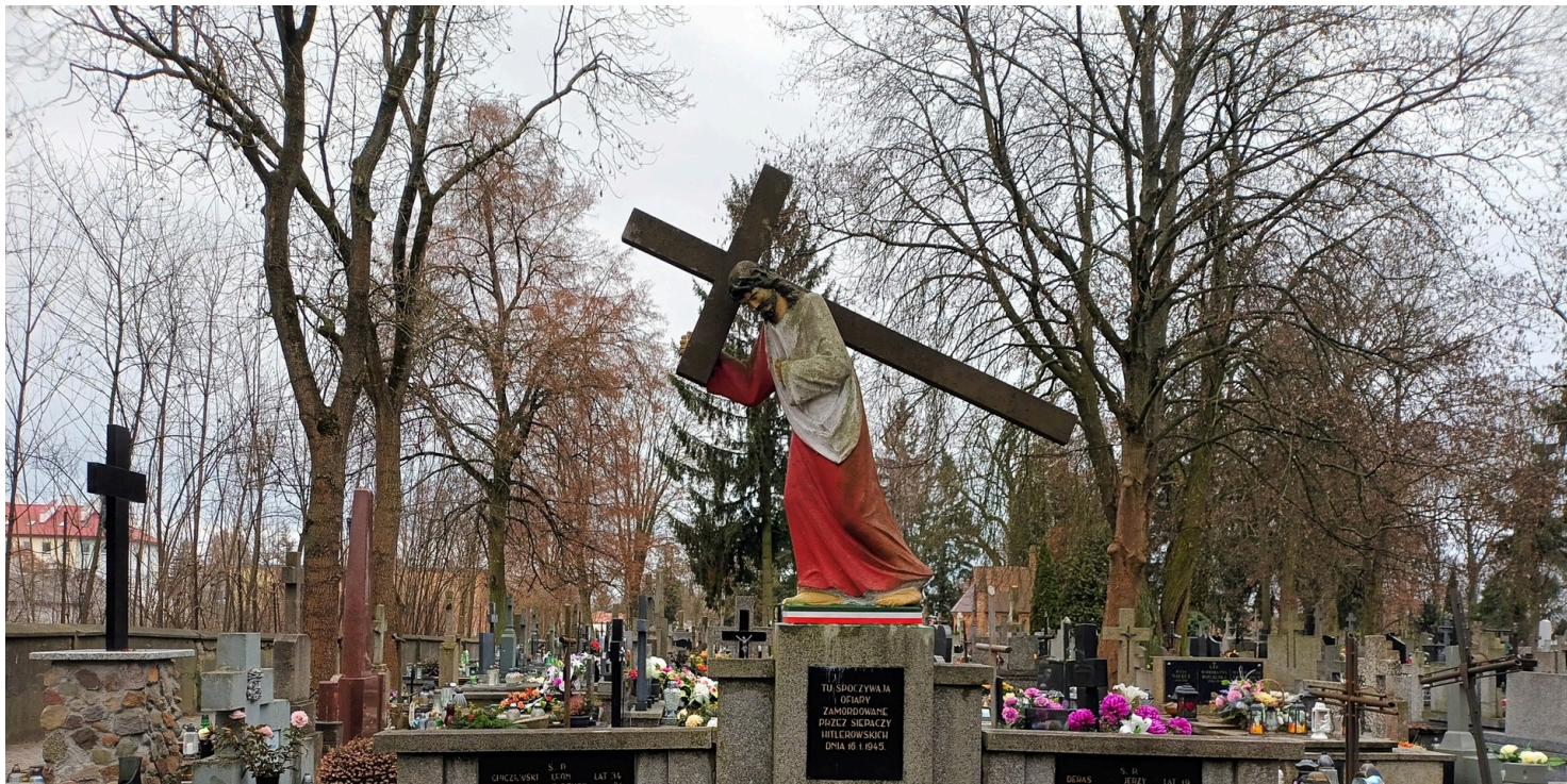
Cmentarz parafialny w Ciechanowie.

https://przystanekhistoria.pl/pa2/teksty/105132,Mord-w-Ciechanowie.html