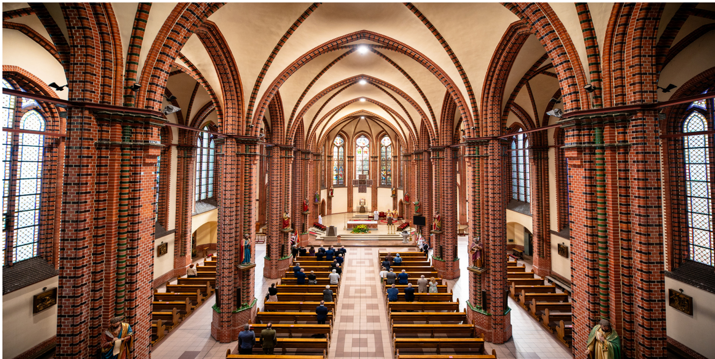
Kościół św. Apostołów Piotra i Pawła w Katowicach, 2023 r.

https://przystanekhistoria.pl/pa2/teksty/105048,Kosciol-z-pomoca-poszkodowanym-w-stanie-wojennym-Diecezja-katowicka.html