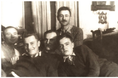
Uczestnicy I kursu maturalnego „Kuznicy”, 1940-1942