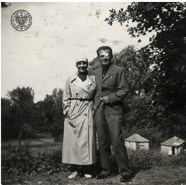
Generał Michał Tokarzewski-Karaszewicz w mundurze gen. bryg.

W listopadzie 1918 r. wstąpił do Wojska Polskiego i w stopniu podpułkownika dowodził 5. Pułkiem Piechoty Legionów. Kierował odsieczą dla walczącego z Ukraińcami Lwowa. W 1919 r. uczestniczył w wyprawie wileńskiej i zajęciu Wilna. W marcu 1920 r. został szefem Departamentu Piechoty Ministerstwa Spraw Wojskowych. W tym też roku awansowano go na pułkownika.