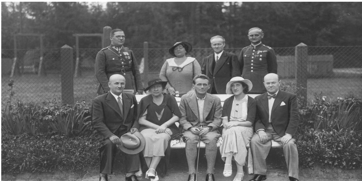
Michał Tokarzewski-Karaszewicz (siedzi w środku) podczas pobytu w Oficerskim Domu Wypoczynkowym w Truskawcu k. Drohobycza, 1934 r.

https://przystanekhistoria.pl/pa2/teksty/104983,General-Michal-Tokarzewski-Karaszewicz.html