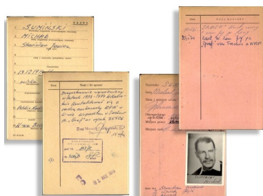
Karty dotyczące Michała Sumińskiego z kartoteki

Więcej interesujących materiałów na profilu Archiwum IPN