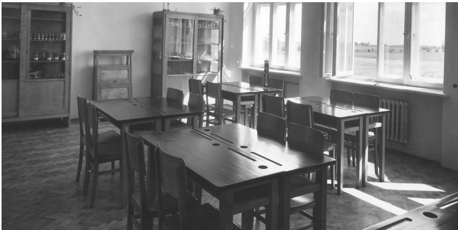
Jedna z sal wykładowych Państwowego Liceum Gospodarstwa Wiejskiego im. Marszałka Józefa Piłsudskiego w Gołotczyźnie, 1939 r.

https://przystanekhistoria.pl/pa2/teksty/104880,W-sluzbie-Polsce-Lucyna-Janikowa.html