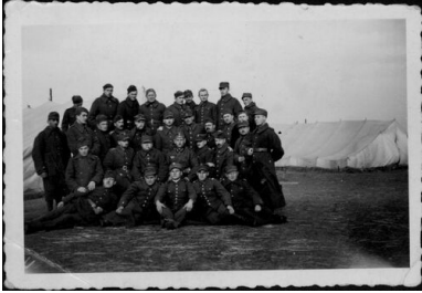
Fotografia z okresu uwięzienia w Stalagu VIII A w Görlitz (1939-1940 r.)