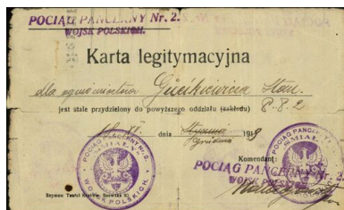
Karta legitymacyjna ogniomistrza pociągu pancernego nr 2 „Śmiały” z 1918 r.