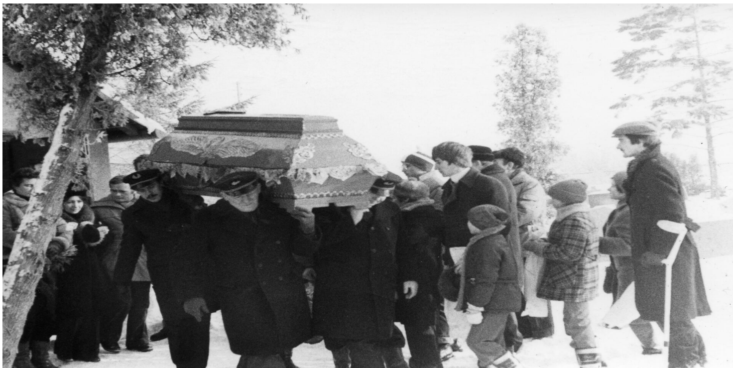
Uroczystości pogrzebowe górnika zastrzelonego podczas pacyfikacji KWK "Wujek", Katowice, 21 XII 1981 r.

https://przystanekhistoria.pl/pa2/teksty/104841,Zamordowano-mu-kolegow-na-terenie-kopalni.html