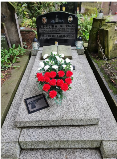
Grób Piotra Wilniewczyca na Cmentarzu Powązkowskim w Warszawie

Piotr Wilniewicz zmarł 23 grudnia 1960 r. w Warszawie. Został pochowany na cmentarzu Powązkowskim.