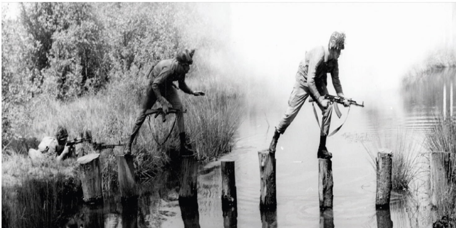
Terenowe ćwiczenia wojskowe, 1980 r.

https://przystanekhistoria.pl/pa2/teksty/104646,Za-opor-marsz-do-wojska.html