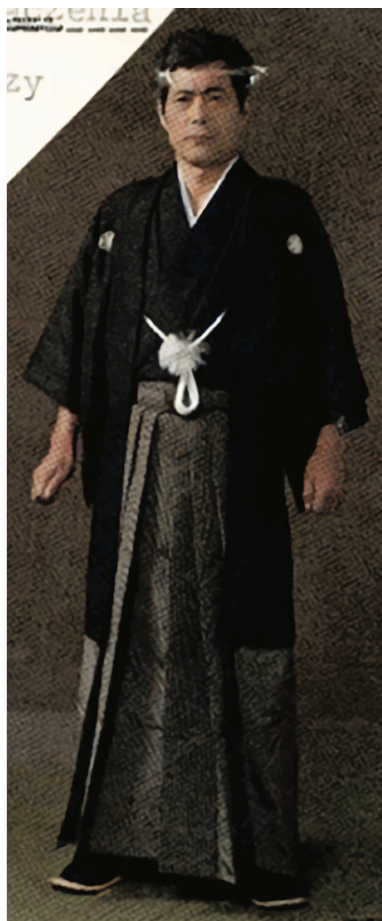
„Capricorn” w kimonie

Tekst pochodzi z numeru 11/2022 „Biuletynu IPN”