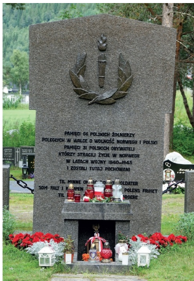
Polska kwatera wojskowa na cmentarzu w Ankenes.

Na południu i zachodzie Norwegii z konfrontacji zwycięsko wychodzili jednak Niemcy. Zgrupowanie bojowe norweskiej 4. Dywizji Piechoty, operującej samodzielnie w rejonie Bergen-Stavanger, utrzymało się do końca kwietnia. Chaotyczne, kiepsko zaplanowane i jeszcze gorzej przeprowadzone lądowania alianckie w Namsos i Åndalsnes (12–19 kwietnia) zakończyły się fatalnie. Zamiast odbić Trondheim i utworzyć stabilną bazę do dalszych działań, wysadzone oddziały zostały powstrzymane i już 2 maja zdecydowano się je ewakuować. Sukces niemiecki wynikał w dużej mierze z przewagi w powietrzu, co skutecznie paraliżowało brytyjską marynarkę.