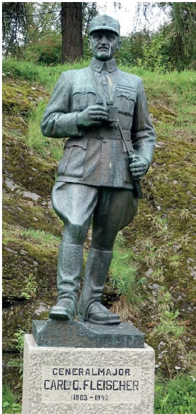
Pomnik dowódcy 6. Dywizji Piechoty gen. Carla Gustava Fleischera w Harstad.

Na początku maja Brytyjczycy usiłowali przegrodzić Niemcom drogą w Bodø, Mo i Rana oraz Mosjøen. Mimo kilku porażek związali tam Niemców do końca maja, ograniczając znacznie ich możliwości działań przeciwko sojuszniczemu zgrupowaniu. Straty w okrętach były jednak duże. To pod Bodø 14 maja został zbombardowany przez Luftwaffe i zatonął polski transatlantyk „Chrobry” (zaadaptowany na transportowiec wojskowy). Na jego pokładzie znajdował się batalion Gwardii Irlandzkiej.