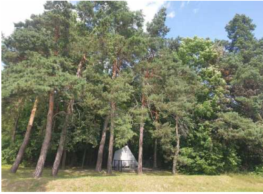
Pomnik w Lesie Weteckim