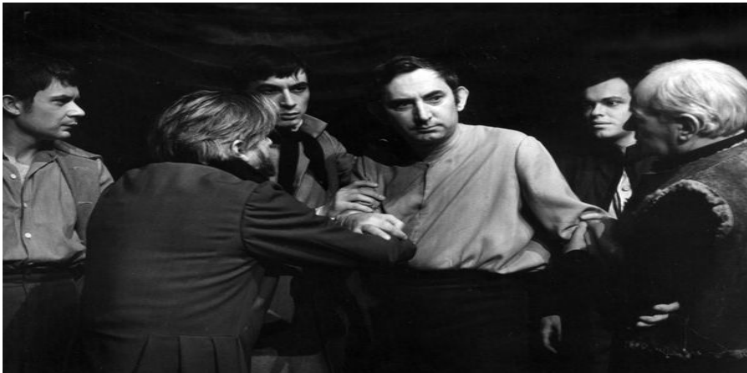
Premiera 25 XI 1967 r. w Teatrze Narodowym. W środku, od przodu, Gustaw Holoubek w roli Konrada

https://przystanekhistoria.pl/pa2/teksty/104335,Najwazniejszy-spektakl-teatralny-w-polskiej-historii-Dziady-w-iscenizacji-Kazim.html