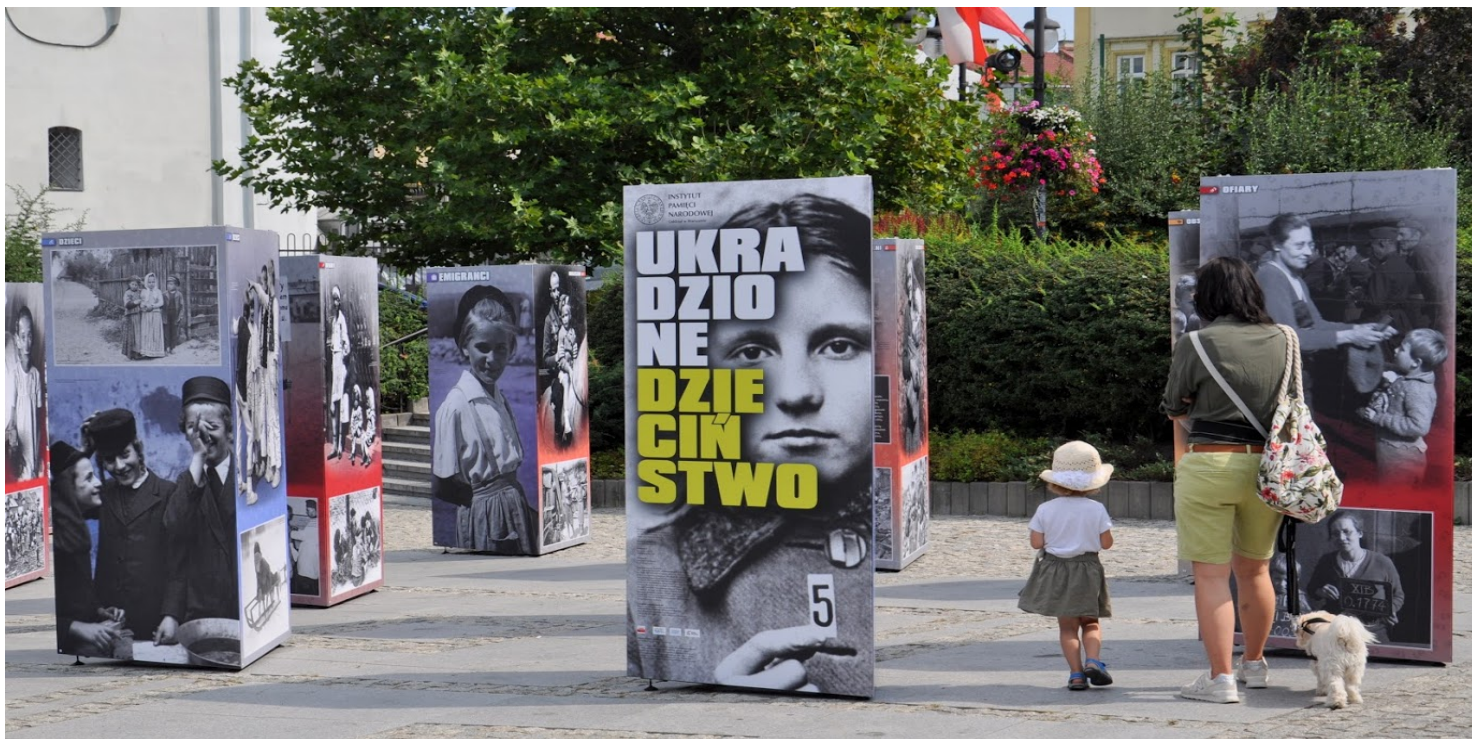
Wystawa IPN „Ukradzone dzieciństwo” - Przemyśl, 2019 r.

https://przystanekhistoria.pl/pa2/teksty/104256,Wywiezienie-do-III-Rzeszy-i-repatriacja-Jozefa-Niedbaly.html