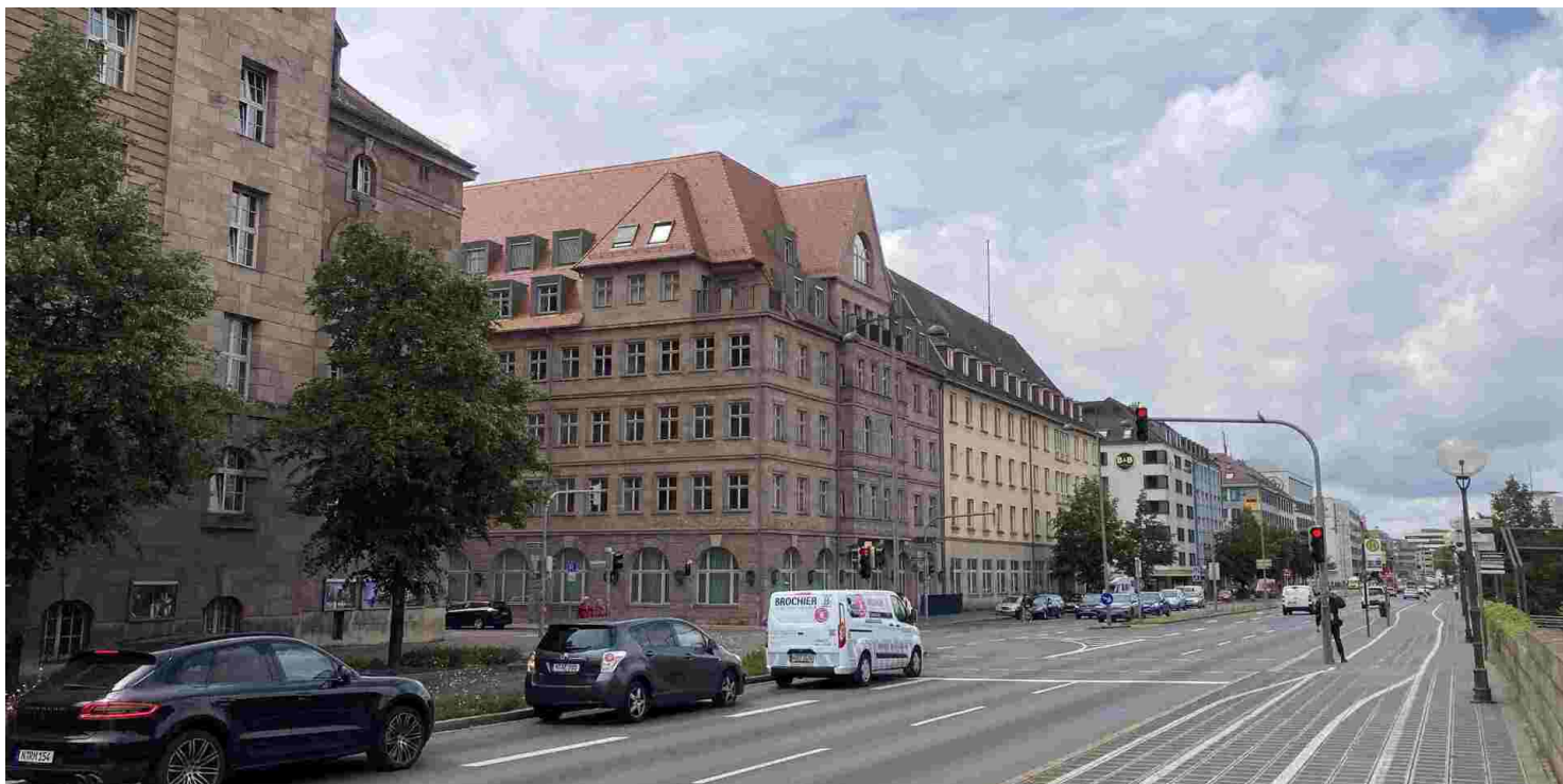
Deutscher Hof, lato 2023 r.

https://przystanekhistoria.pl/pa2/teksty/104253,Norymberga-sladam-nazistowskiej-przeszlosci.html