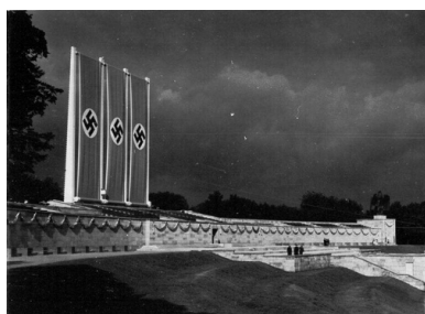
Luitpoldarena, 1937 r.