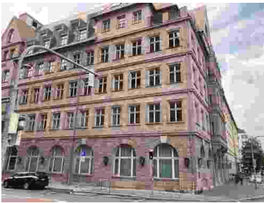
Deutscher Hof, lato 2023 r.