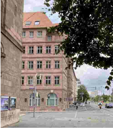
Deutscher Hof, lato 2023 r.