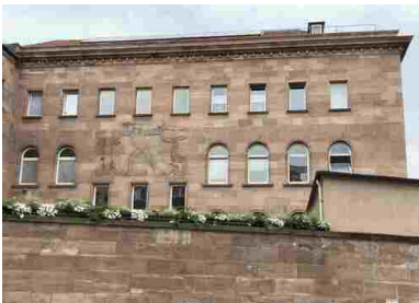
Gauhaus, lato 2023 r.

Na terenie zjazdów planowano zbudować Deutsche Stadion (Stadion Niemiecki) według projektu Alberta Speera. Miała to być największa na świecie arena, wysoka na ponad 100 m, mogąca pomieścić 405 tys. osób. Kamień węgielny wmurowano we wrześniu 1937 r. Z uwagi na wielkość obiektu zrodziło się pytanie, skąd pozyskiwać materiały do jego budowy. Speer znalazł rozwiązanie. SS założyło spółkę Deutschen Erd- und Steinwerke , która prowadziła kamieniołomy granitu, a pracowali w nich więźniowie obozów koncentracyjnych. Do 1941 r. zabezpieczono kontrakty na dostawy do Norymbergi z obozów w Natzweiler-Struthof w Alzacji, Flossenbürg i Gross-Rosen. W kamieniołomach organizowano także obróbkę kamienia, m.in. właśnie na budowę Deutsche Stadion . W pierwszych miesiącach 1941 r. pięciuset więźniów łopatami i maszynami kopało fundamenty pod przyszły obiekt. Prace nad nim nie wyszły jednak poza fazę wykopalisk. Pozostawiony wykop został wypełniony wodami gruntowymi wskutek czego powstało Silbersee (Srebrne Jezioro).