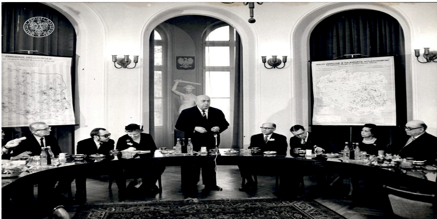
Józef Cyrankiewicz, przewodniczący ZBOWiD, na obradach Spotkania b. Korespondentów Norymberskich.

https://przystanekhistoria.pl/pa2/teksty/104235,Spotkanie-Bylych-Korespondentow-Norymberskich.html