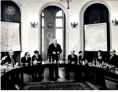
Józef Cyrankiewicz, przewodniczący ZBoWiD, na obradach Spotkania b. Korespondentów Norymberskich.

Obrady w Jabłonie odbywały się w formule „okrągłego stołu” i towarzyszyły im inne wydarzenia, w tym m.in.: zwiedzanie Warszawy, Wrocławia i Krakowa, wyjazd do obozu koncentracyjnego w Oświęcimiu, wizyta w teatrze, spotkania z przedstawicielami nauki i kultury. W obradach brał udział Józef Cyrankiewicz, reprezentujący władze ZBoWiD-u. Na zakończenie spotkania opracowany został komunikat, w którym podkreślono wagę procesu norymberskiego, jak również fakt, iż nie spełnił on wielu nadziei, jakie w nim pokładano. Zauważono także, że pojawiają się próby wypaczenia historii, stwarzające zagrożenie dla bezpieczeństwa Europy i świata, będące pożywką dla szowinizmów i nacjonalizmów. Zaznaczono też, że istnieje potrzeba utrzymywania stałych kontaktów międzynarodowych, wymiany myśli i doświadczeń, rzetelnej, nieustającej edukacji historycznej, by doświadczenia II wojny światowej nigdy się nie powtórzyły.