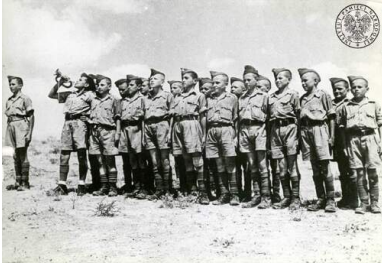
Uczniowie Junackiej Szkoły Kadetów podczas zbiórki na terenie obozu w Palestynie, ok. 1942 r.