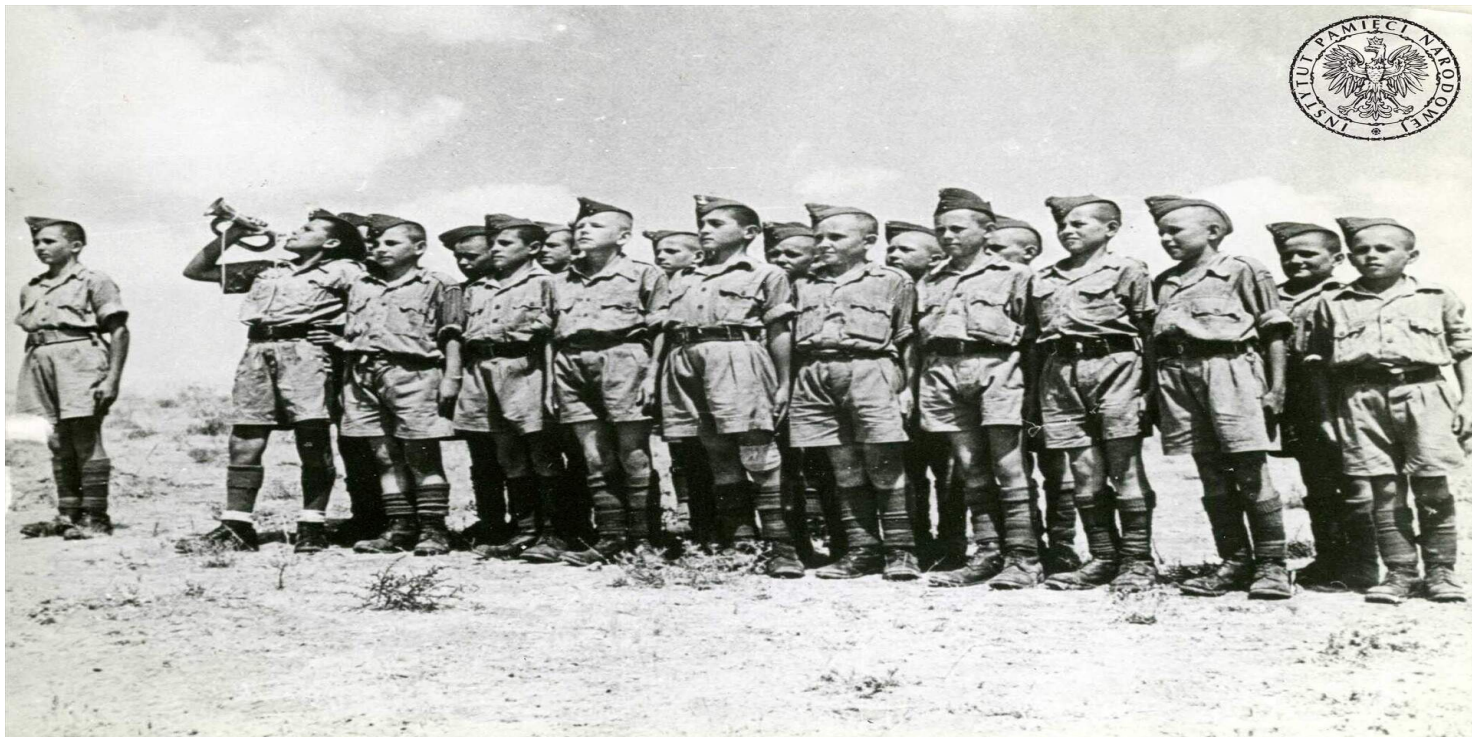
Uczniowie Junackiej Szkoły Kadetów podczas zbiórki na terenie obozu w Palestynie, ok. 1942 r.

https://przystanekhistoria.pl/pa2/teksty/104119,Wojskowe-Szkoly-Junakow-i-Junaczek-w-ZSRS-Ewenement-uzasadniony-koniecznoscia-po.html