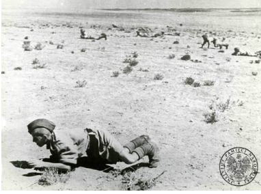
Uczniowie Junackiej Szkoły Kadetów podczas ćwiczeń na terenie obozu w Palestynie