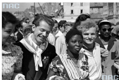
V Światowy Festiwal Młodzieży i Studentów w Warszawie

W 1956 r. zaczęło ukazywać się coraz więcej tekstów o charakterze politycznym – najczęściej wyrażających popularne społecznie hasła demokratyzacji systemu, ale także przypominających o represjach wobec żołnierzy AK czy – gdy pojawiło się przyzwolenie PZPR na poruszanie tej tematyki – opisujących wynaturzenia stalinowskiego aparatu sprawiedliwości. Tygodnik z czasem stał się zatem „tubą wolności” – nie można było w nim napisać wszystkiego, niemniej drukowano teksty, które po latach ścisłej cenzury rodziły wrażenie powrotu wolności słowa.