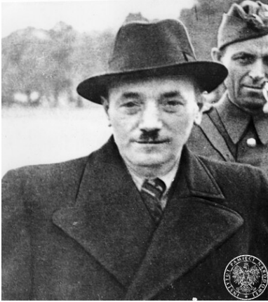
Bolesław Bierut