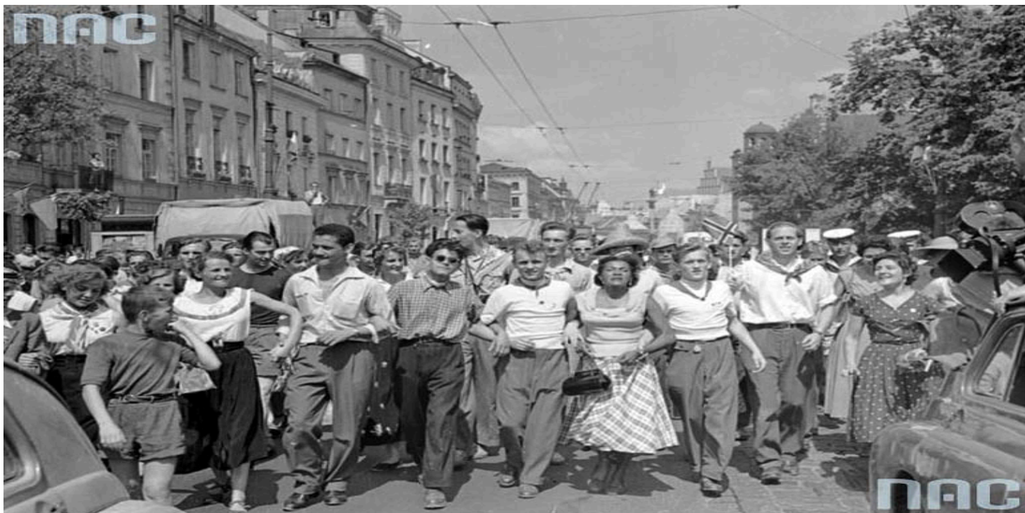
V Światowy Festiwal Młodzieży i Studentów w Warszawie

https://przystanekhistoria.pl/pa2/teksty/103962,Odwilz-pod-kontrola.html