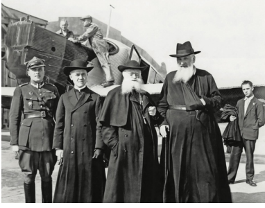
Metropolita mohylewski abp Edward Ropp (w okularach) i abp metropolita lwowski obrządku greckokatolickiego Andrzej Szeptycki (z prawej), Poznań, 1930 r.