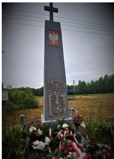
Pomnik upamiętniający ofiary pacyfikacji wsi Rakówka, znajdujący się na terenie tej miejscowości.