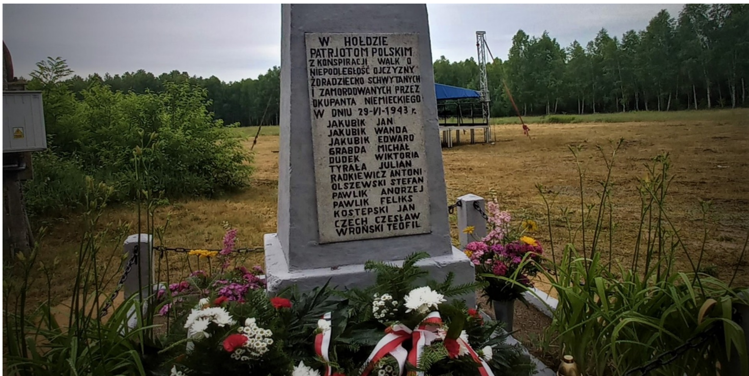
Pomnik upamiętniający ofiary pacyfikacji wsi Rakówka, znajdujący się na terenie tej miejscowości.

https://przystanekhistoria.pl/pa2/teksty/103945,Pacyfikacja-wsi-Rakowka.html