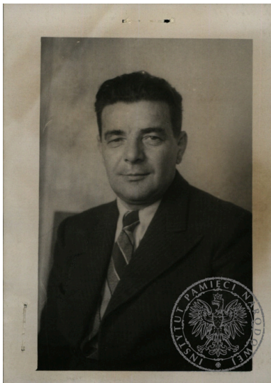
Roman Rudkowski.

Od połowy 1941 roku służył w Oddziale VI Sztabu Naczelnego Wodza. Od października 1941 roku był oficerem łącznikowym Oddziału VI przy brytyjskim 138. Dywizjonie Specjalnym, a od marca 1942 roku także kierownikiem referatu łączności lotniczej (operacji zrzutowych) w Wydziale „S” (technicznym) Inspektoratu Polskich Sił Powietrznych.